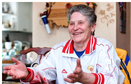
Заслуженный мастер спорта — Галина Алексеевна Кулакова

Ее имя знакомо каждому жителю не только в Удмуртии, но и за ее пределами. Она — заслуженный мастер спорта, заслуженный работник культуры УР, Почетный гражданин