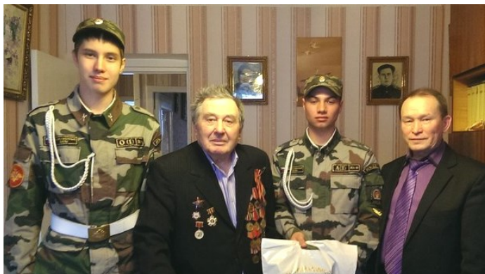
Сотрудники военного комиссариата ежегодно поздравляют ветерана с Днем Победы

Германия приняла капитуляцию, ведь дальнейшее сражение для нее было бесполезным. Что я тогда чувствовал, передать словами сложно. Это был три-