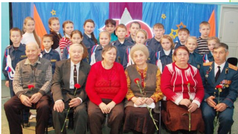
Военно-патриотическому клубу «Долг» — 10 лет

годен к службе». Кроме того, кодекс призывает кадета быть храбрым и помнить, что «заносчивость, свойственная