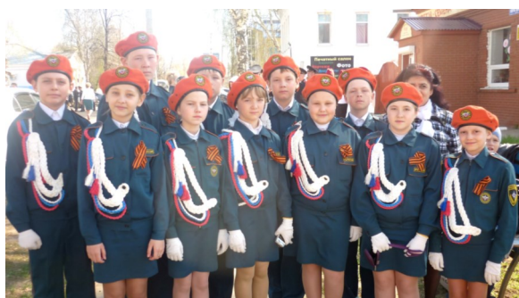
Кадеты Камбарской школы №2 — настоящие патриоты, гордость района

юности, не есть храбрость. Кадет должен быть всегда благоразумным и обдумывать свои поступки хладнокровно и осторожно». И это далеко не все пункты, которым нужно следовать настоящему кадету. Ребята дорожат кодексом, а это значит, что каждый из них — сформировавшаяся личность, которая несет ответственность за свои поступки