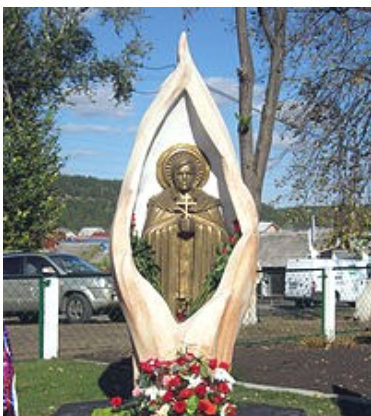
Памятник Евгению Родионову в г. Кузнецке

колесом — так, словно на параде, стоит юный солдат на иконе, которую протягивает бедная женщина с добрыми и чистыми, как капля дождя глазами. До дрожи, не правда ли?