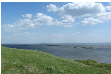
Вид с Голюшурма

и дабы не гневить местных духов, сюда лучше лишь раз не заглядывать. Но стоит о них знать и беречь как символ памяти и уважения к прошлому. Тыловось — место языческого моления в районе д. Удмуртский Тоймобаш.