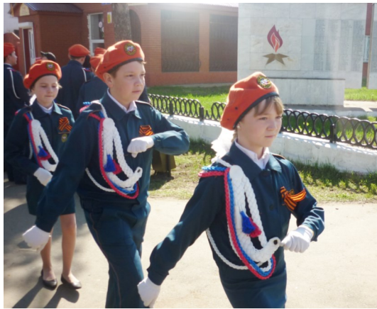
Вахта Памяти 9 мая

«Долг» работает по программе «Воспитать патриотов», в рамках которой организуются встречи с ветеранами