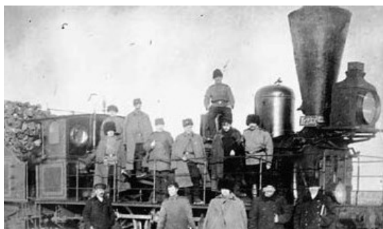
Строительство первой в республике узкоколейки Ижевск — Гольяны

Побывал на земле завьяловской знаменитый Емельян Пугачев: разграбил церкви — украл священные покрывала, ризы, книги, увел скот и лошадей церковнослужителей. После этого случая рано утром собрались представители прихода церкви, новокрещены села Завьялово, чтобы добиться справедливости и наказать виновного. Но этому не суждено было случиться. Пугачевцы связали их и повели к Емельяну, кото-