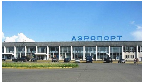
Аэропорт в с. Завьялово

Аэропорт славится не только высотой полетов Як-42, Ту-134, Ту-154, Boeing